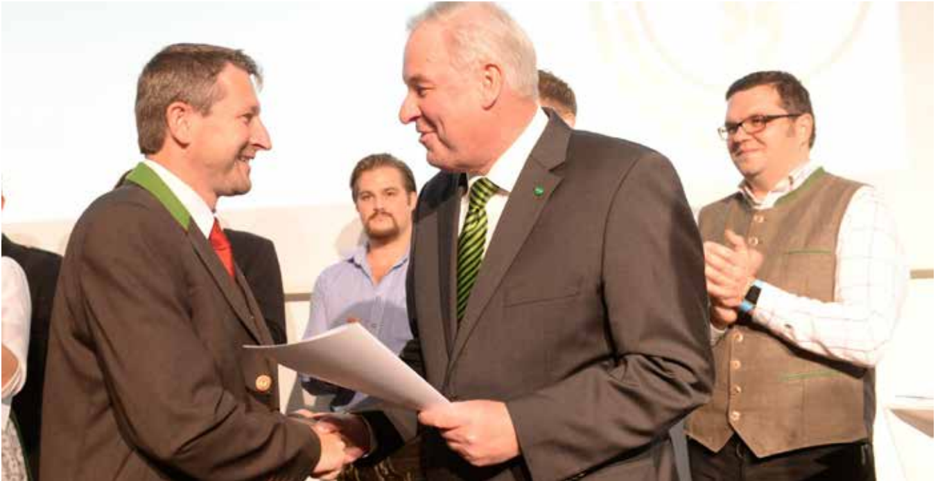
>> Landeshauptmann Hermann Schützenhöfer gratuliert zum erfolgreichen Führungskräfteseminar.

Die Bevölkerung ist sehr froh, dass wir so gut ausgebildete und hochmotivierte Feuerwehren haben.